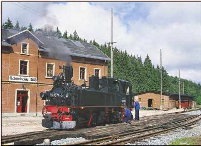
Vollampf in Schönheide Süd mit 99 582: Zum II. WCd-Festival 2008!

Bezüglich des nebenstehenden Fahrplans zum II. WCd-Festival ist zu beachten: